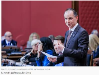
Le ministre des Finances, Eric Girard